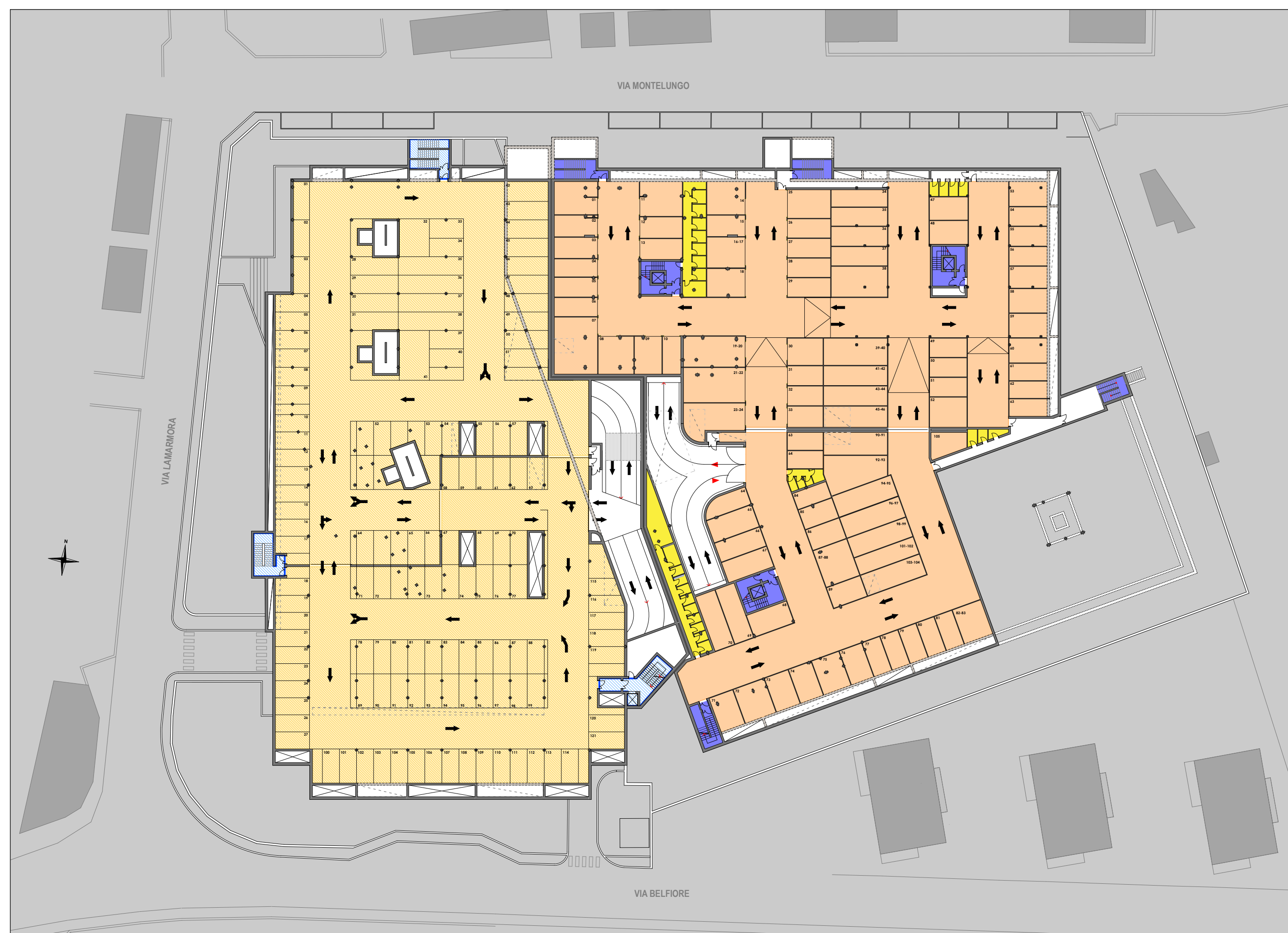
PIANTA LIVELLO C1 - scala 1:500

SISTEMA DI GESTIONE QUALITÀ UNI EN ISO 9001:2008 CERTIFICATO n° 12382 CSC/CERTIFICATION n° 4911/ROMA